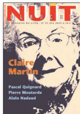
N° 91, été 2003

L'Antiquité est une véritable passion pour l'auteure de la Colombie-Britannique Annabel Lyon qui, après Le juste milieu , nous revient avec Une jeune fille sage (Alto), un roman sur la fille d'Alexandre le Grand. Contrairement aux filles de son âge, Pythias préfère suivre les enseignements de son précepteur, Aristote. À la mort de son père, elle devra inventer son propre destin.