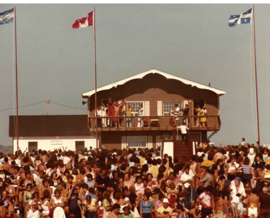
Foule rassemblée aux 14 milles pour encourager les nageurs, vers 1981.