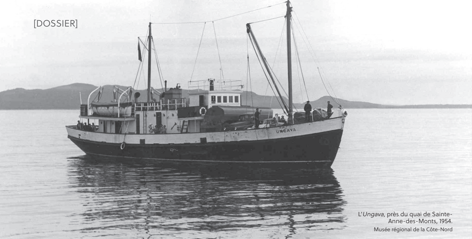
L'Ungava, près du quai de Sainte-Anne-des-Monts, 1954.