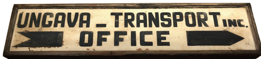
Panneau signalétique alors situé sur le quai de Sainte-Anne-des-Monts pour indiquer l'endroit où l'on se procurait notamment les billets.

Corrélation ou pas, arrivent à cette époque de nombreux marins et capitaines de bateau dans la région de Sainte-Anne-des-Monts et de Cap-Chat : les Langlois et les Simard,