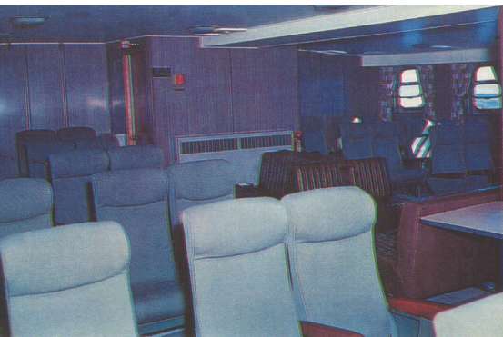
Le M.V. Gaspésien, vers 1960. L'aménagement intérieur est réalisé aux chantiers de la Davie à Lévis. Société d'histoire de la Haute-Gaspésie

pour effectuer l'embarquement et le débarquement des voitures; une trentaine à chaque traversée.