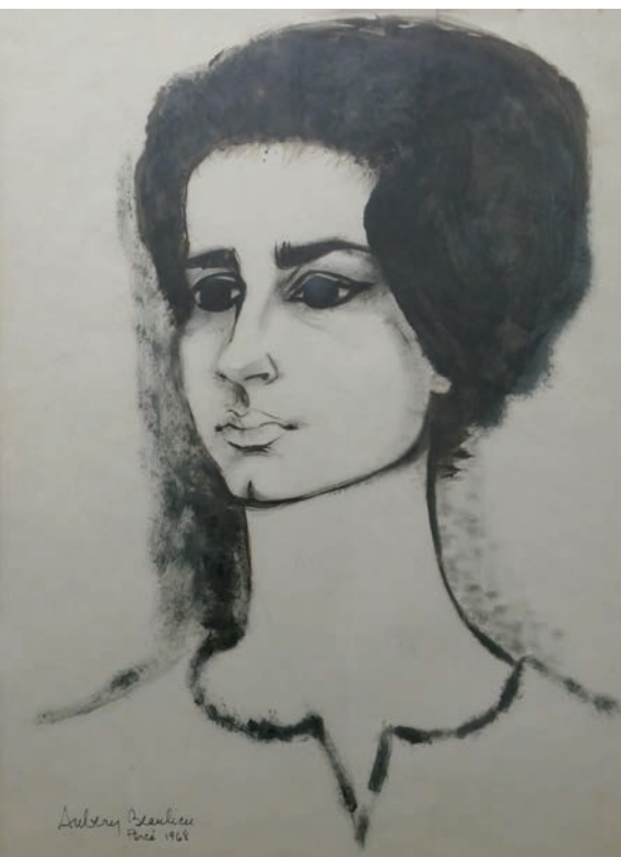
Simone Aubry Beaulieu, Portrait de Gemma , huile sur papier, 69 x 51 cm, 1968.

des bois sculptés par la mer qui les inspirent. Lors de l'une de ces expéditions, elles tombent sur une imposante figure de proue, représentant une femme plantureuse coiffée d'une couronne de plumes (en bois). Plutôt que de se chicaner sur qui l'a trouvée en premier, Suzanne et Simone concluent une entente, cosignée sur un document, de se partager la garde de cette figure de proue, chacune l'ayant à tour de rôle pour cinq ans. Suzanne Guité, lors de