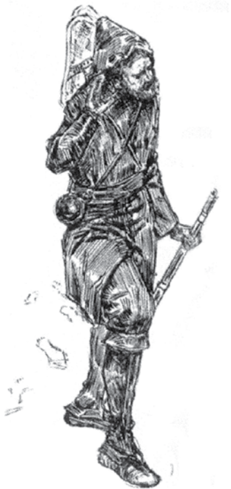
Un marcheur, début du 20 e siècle.