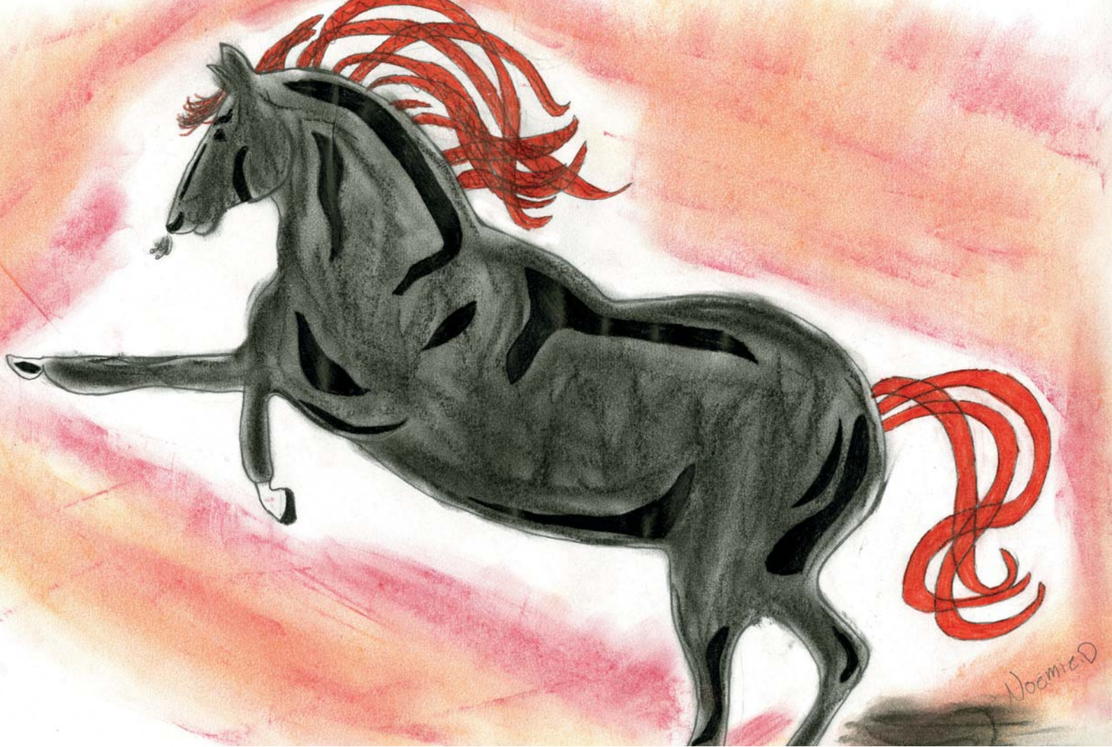
Cheval noir aux yeux rouges comme du feu avec des étincelles qui s'échappent de sa crinière et de sa queue, dessin, 2019.