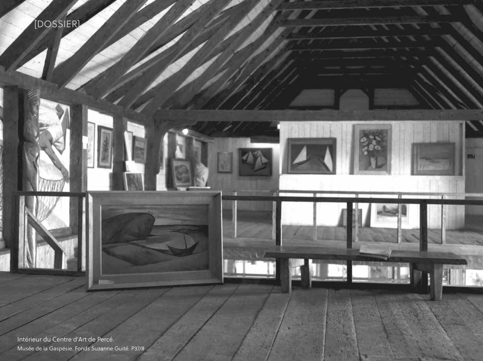
Intérieur du Centre d'Art de Percé. Musée de la Gaspésie. Fonds Suzanne Guité. P37/8