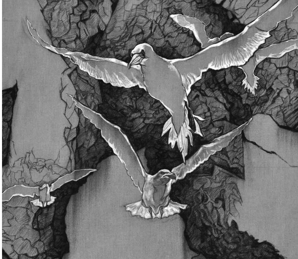
Thierry Pertuisot, Le trou du Rocher , fusain et acrylique sur toile, 2015. Cette œuvre est actuellement présentée au restaurant de la Maison du pêcheur à Percé. Photo : Thierry Pertuisot Collection privée

* Gagnon, Serge (2007), Attractivité touristique et « sens » géo-anthropologique des territoires , Tourisme et attractivité, Téoros, p. 5-11.