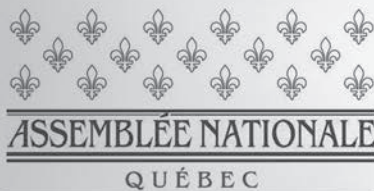
Sylvain Roy Député de Bonaventure

Ce fait montre un peu l'aspect humanitaire de la fonction de gardien du phare. Dans ce domaine, je peux ajouter des milliers d'heures passées à réparer les moteurs des barges des pêcheurs du village. En avril, chaque printemps, la corvée du ménage des moteurs durait un mois. Mon père, ingénieur-mécanicien, avait dans la boutique de la station, les instruments nécessaires à la mécanique; c'était comme une providence car les garages n'existaient pas encore dans notre milieu. Ils venaient, l'un après l'autre,