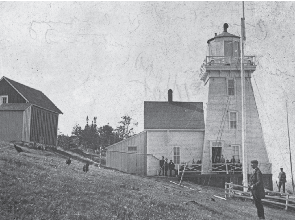
La maison-phare de Fame Point.