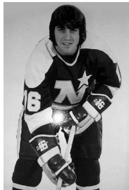
Jude Drouin joue avec les North Stars de Minnesota, entre 1970-71 et 1974-75.

Faisant montre d'un fort caractère, Drouin a joué pendant douze saisons dans la LNH, de 1968-69 à 1980-81, avec successivement les Canadiens et les North Stars, puis les Islanders de New York pour terminer sa carrière avec les Jets de Winnipeg. Reconnu pour ses qualités de fabricant de jeux et doué dans le maniement de