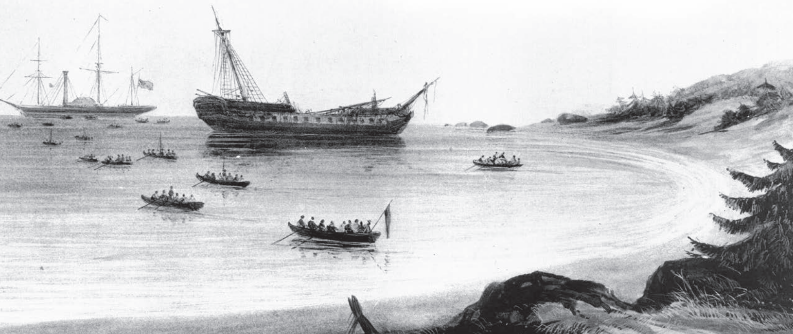
L'abandon de l'épave et le départ de la baie du cap Chatte, 1843.

Dessin : George Russell Dartnell. Bibliothèque et Archives du Canada, C-124863