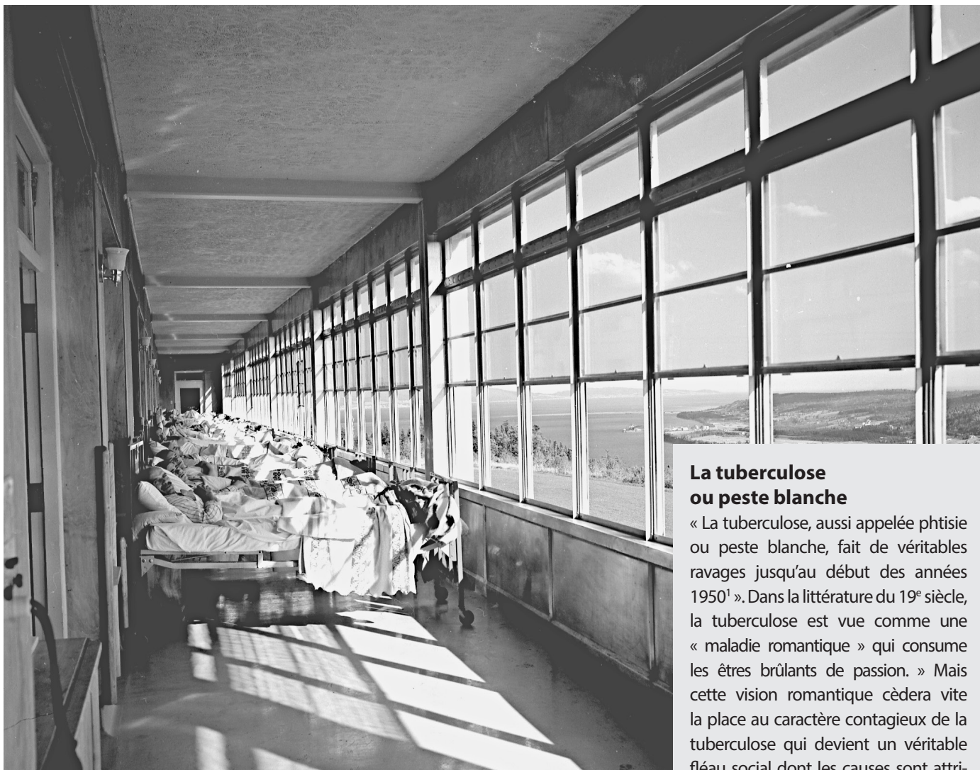
La grande cure au Sanatorium de Gaspé, 1951.