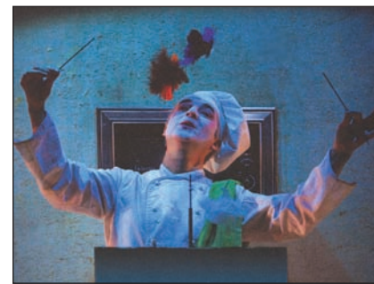
Le Temps des muffins.