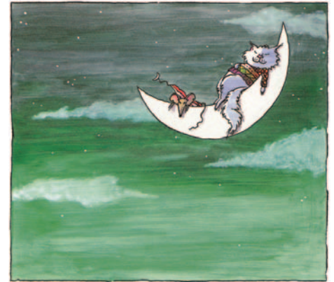
brille l'oreille d'un chat

plutôt silencieux. Dès les toutes premières pages, la caméra s'amuse d'abord à fixer, en gros plan, l'oreille et le chat endormi puis le chat et le lit et la chambre de Rose. En agissant ainsi, l'illustration donne une belle place au félin! Cette longue introduction imagée facilite l'inscription de la nuit comme principal décor. Une nuit où le rêve va bientôt s'immiscer dans le réel en proposant aux enfants une balade au clair de lune.