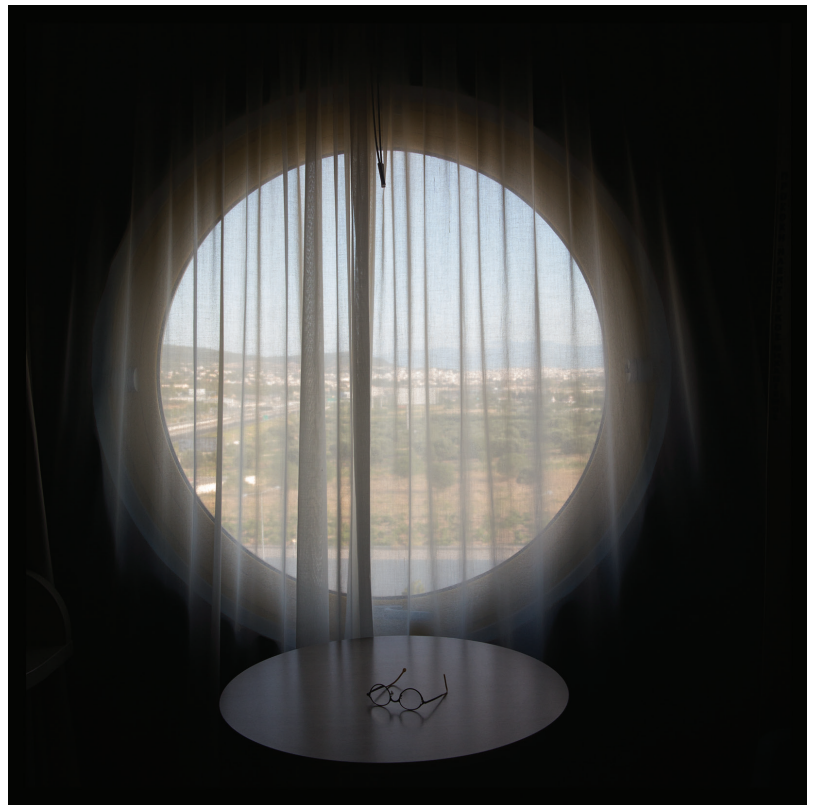
Fenêtre ronde, Athènes, Grèce, juin 2012

10. George Orwell, Politics and the English Language , Penguin Classics, 1945 : « To think clearly is a necessary first step towards political regeneration : so that the fight against bad English is not frivolous and is not the exclusive concern of professional writers. » (Ma traduction.)