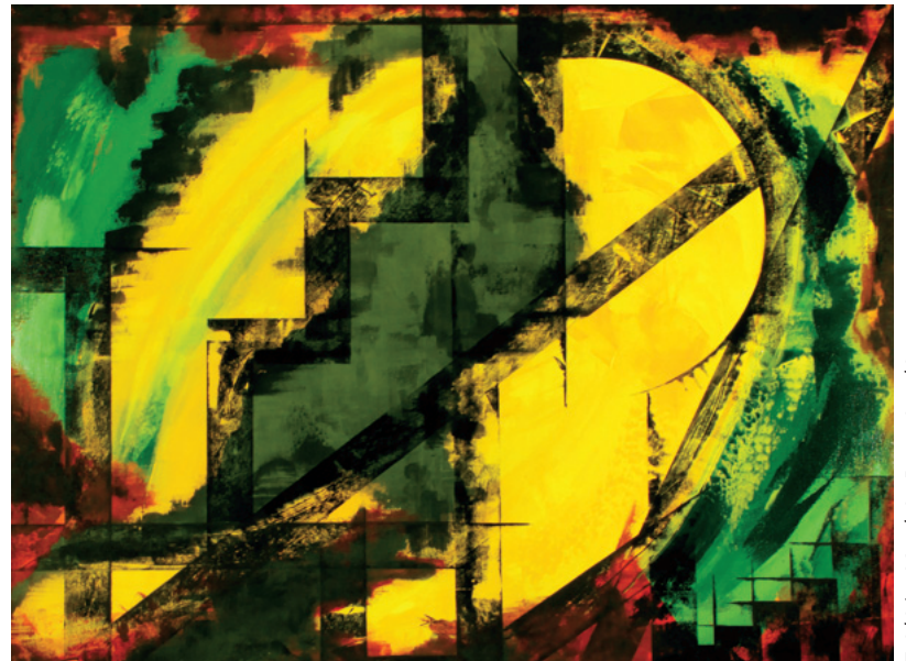
Frédéric Metthé, Beauté volée - 2010

parution novembre 2012 L'Action nationale Éditeur