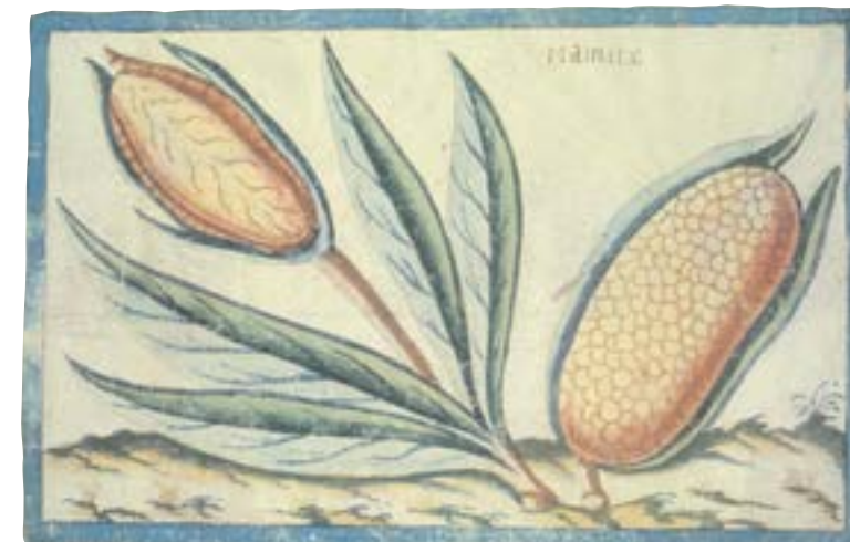
Du maïs rudimentaire. Samuel de Champlain