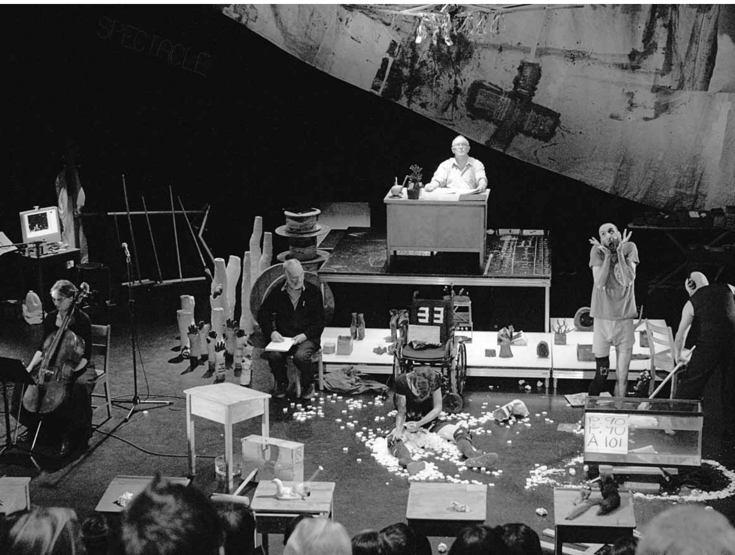
La Jeune-Fille et la mort , performance du Bureau de l'APA, présentée par Premier Acte à l'automne 2010 au Complexe Méduse.