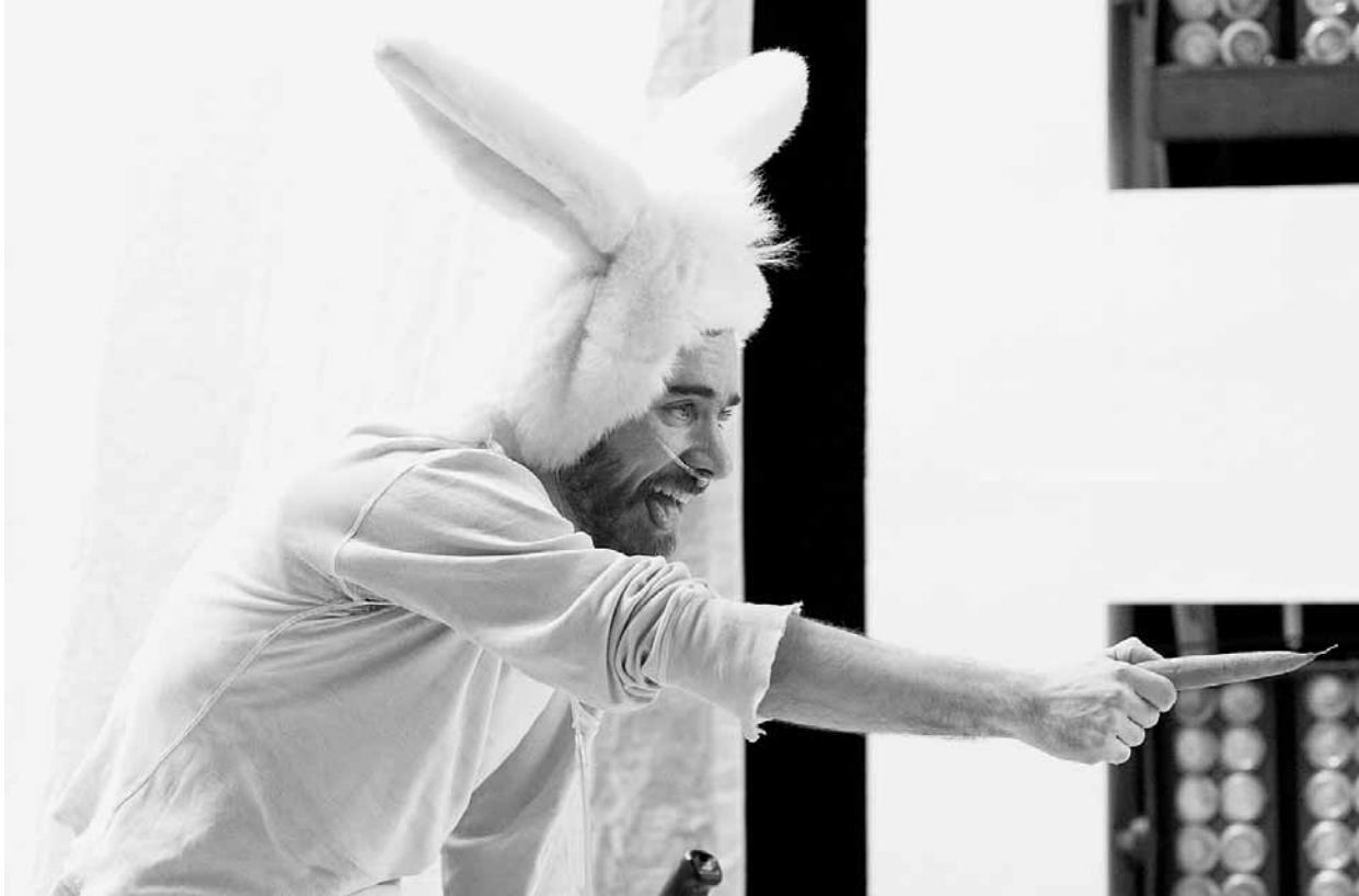
Over my Dead Body de Dave St-Pierre, présenté à Tangente en janvier 2009. © Nicholas Minns.

croyait « intolérablement voyeuriste », détaillant aussi en quoi un tel « art de la victime » rendrait impossible son travail de jugement esthétique.