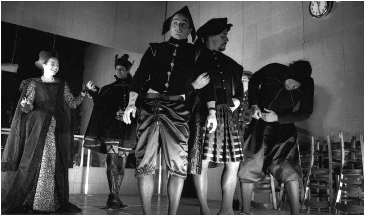
La Tempête , « tradaptée » par Michel Garneau, l'une des trois pièces du « cycle shakespearien » de Robert Lepage présenté notamment au FTA en 1993 (Théâtre Repère).