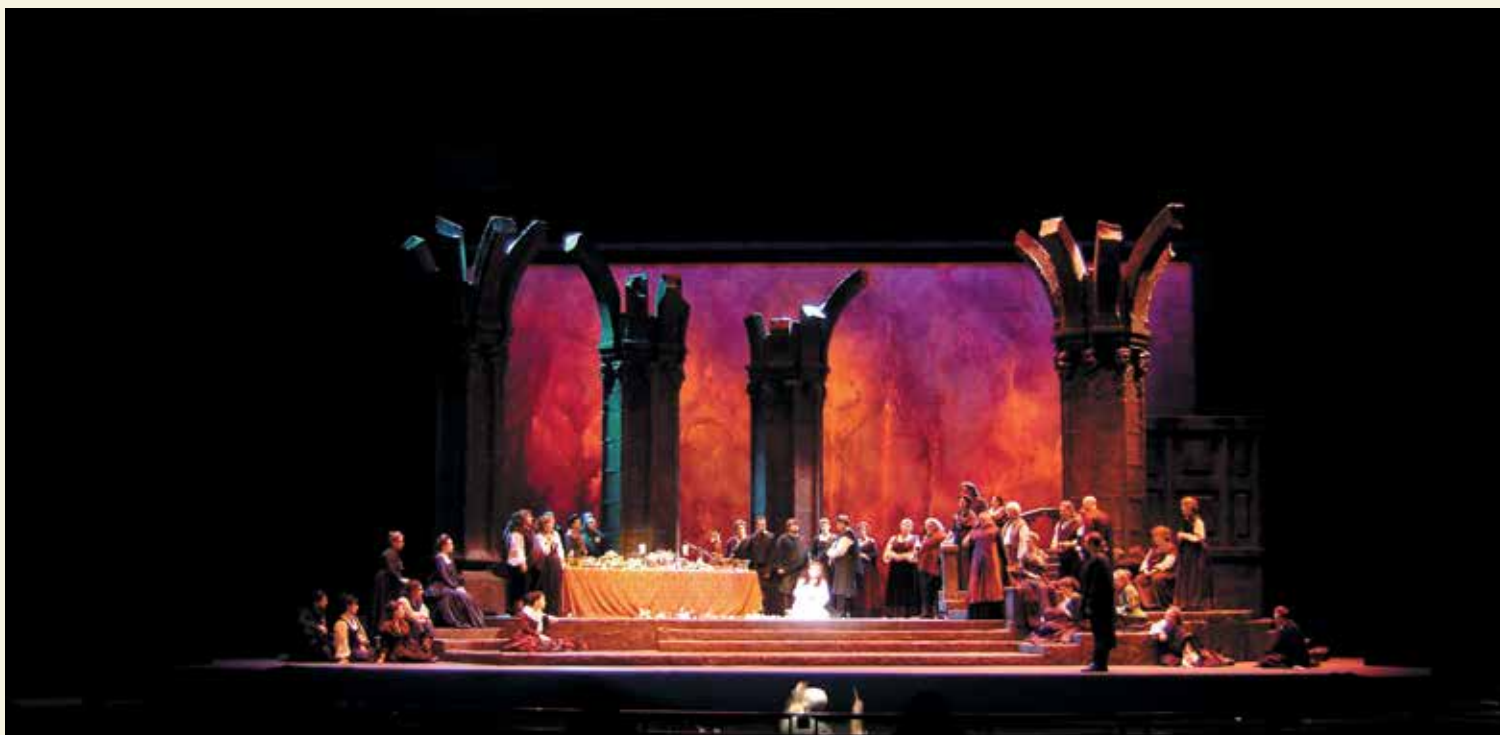
Lucia de Lammermoor de Gaetano Donizetti, mise en scène par David Gately (Dallas Opera), présentée à la salle Wilfrid-Pelletier de la Place des Arts en mai 2009. Conception des éclairages : Anne-Catherine Simard-Deraspe. © A.C.S.D.