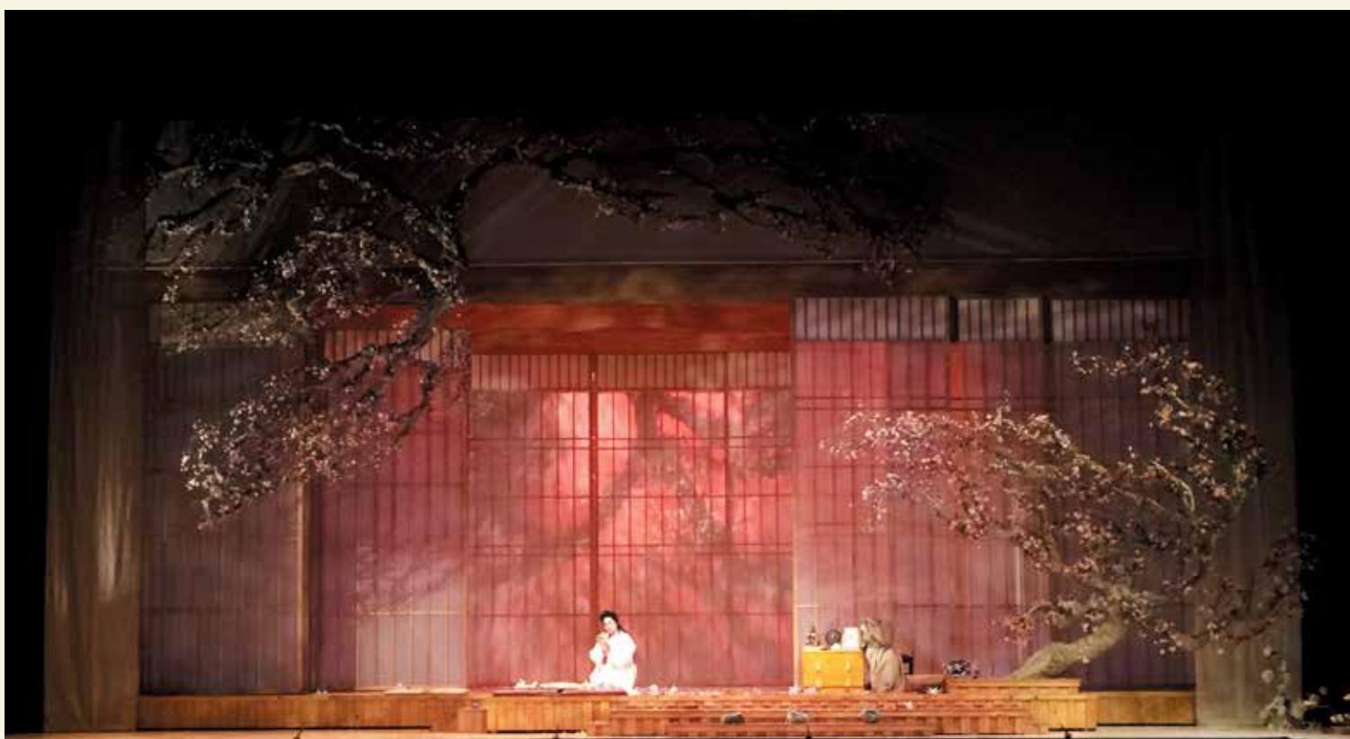
Madama Butterfly de Giacomo Puccini, mise en scène par François Racine (Opéra de Montréal), présentée à la salle Wilfrid-Pelletier de la Place des Arts en septembre 2015.