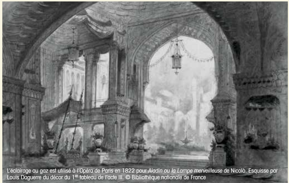
L'éclairage au gaz est utilisé à l'Opéra de Paris en 1822 pour Aladin ou la Lampe merveilleuse de Nicolò. Esquisse par Louis Daguerre du décor du 1 er tableau de l'acte III.