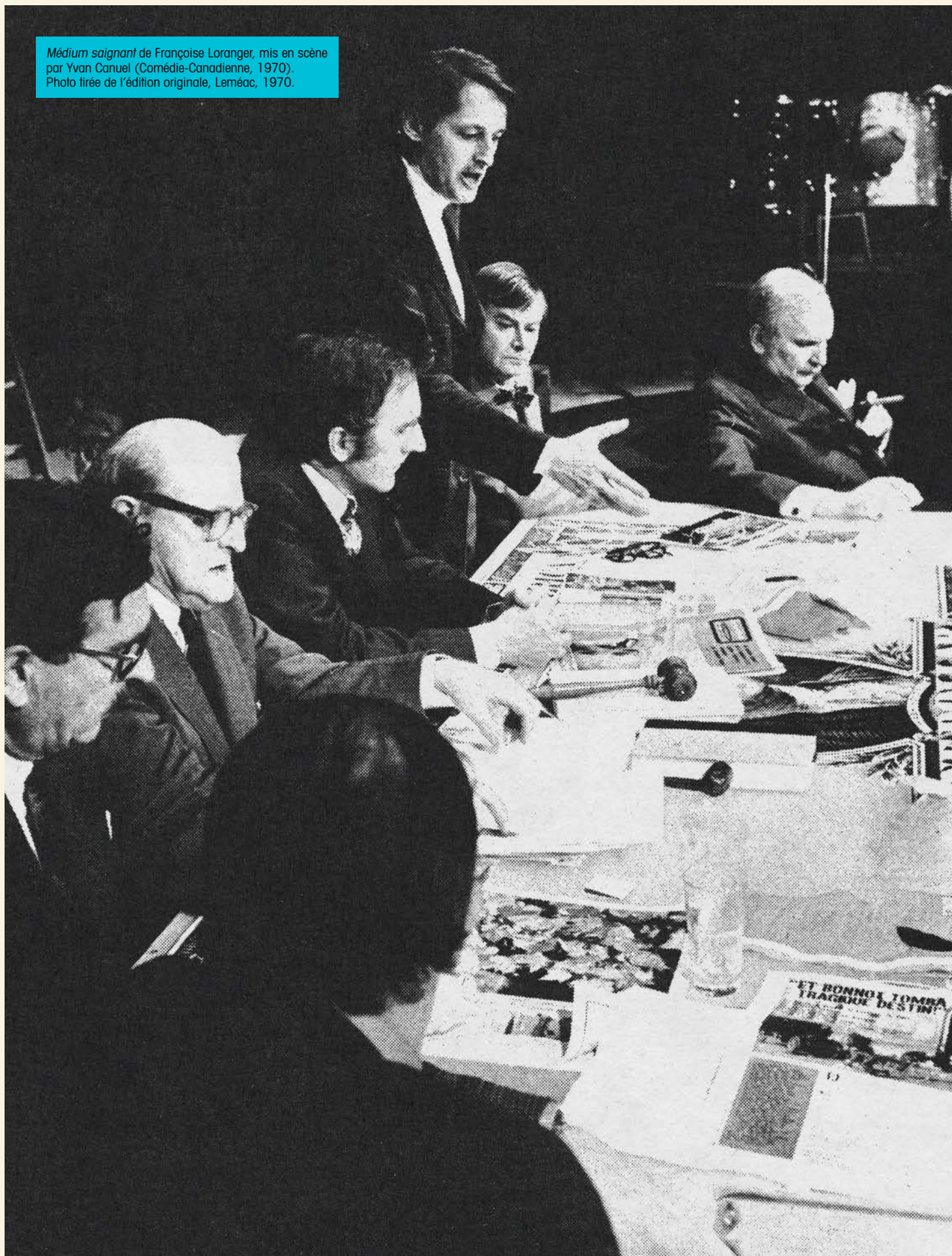
Médium saignant de Françoise Loranger, mis en scène par Yvan Canuel (Comédie-Canadienne, 1970). Photo tirée de l'édition originale, Leméac, 1970.