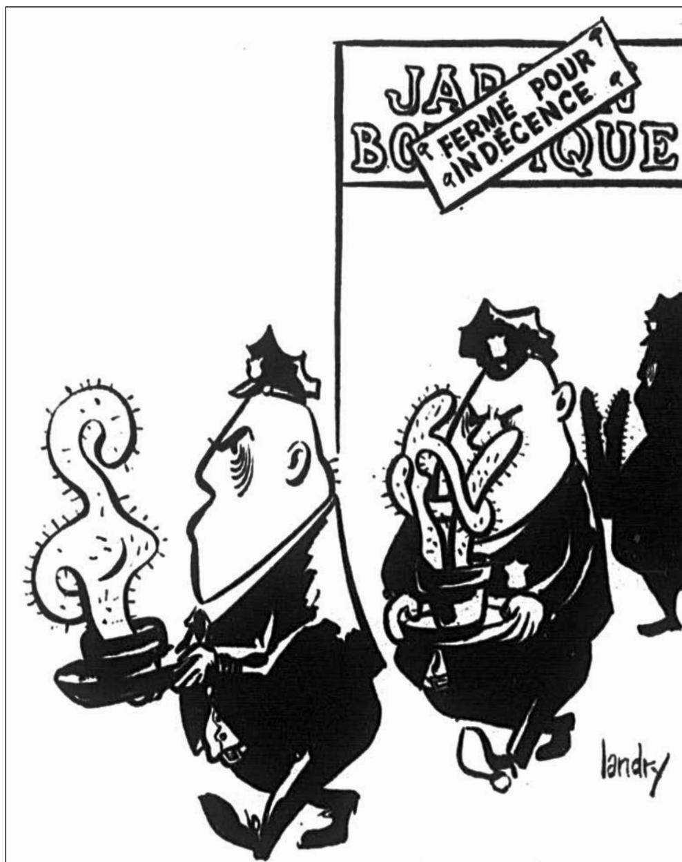
La Presse, 9 janvier 1968.

Cinquante ans plus tard, une reprise d' Équation... permettrait d'évoquer l'époque opaque de la censure au théâtre, qui, par à-coups et laborieusement, a tout de même permis au Québec d'accéder à la modernité. ●