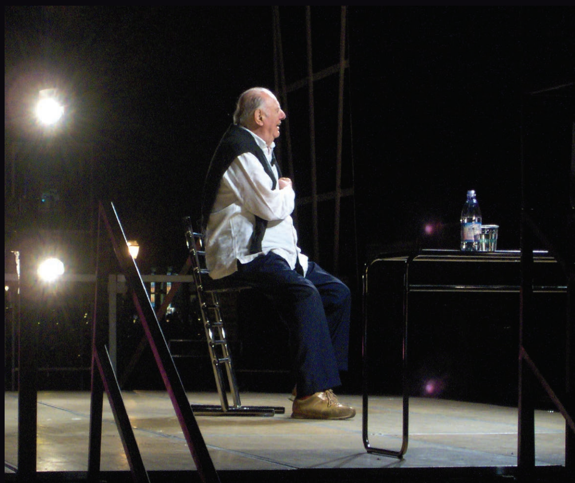
Dario Fo.