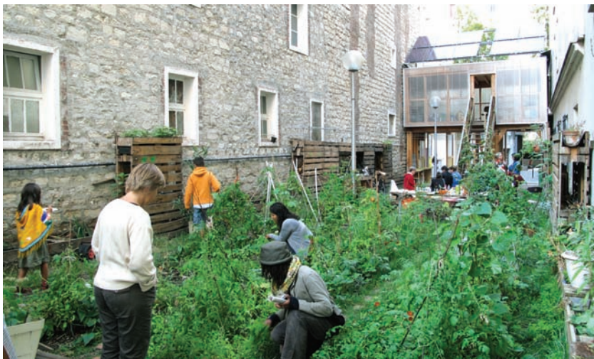
Le Passage 56, jardin partagé, 2009.

L'agencement jardinier nous apprend à traverser les milieux, à passer d'un espace à un autre, à changer d'emplacement et à y revenir. Petit à petit, nous avons pu relier les espaces hétérogènes que nous construisions ensemble avec leurs usagers, en occasionnant des rencontres inhabituelles, des bribes de dialogue, du faire ensemble, des contradictions en douceur : un apprentissage du politique par des temporalités, des dynamiques et des contenus hétérogènes. Plutôt que des formes verbales et délibératives, l'agencement jardinier encourage des pratiques physiques, gestuelles, visuelles, non verbales, et une démocratie incorporée : un vivre ensemble comme corps commun 18 .