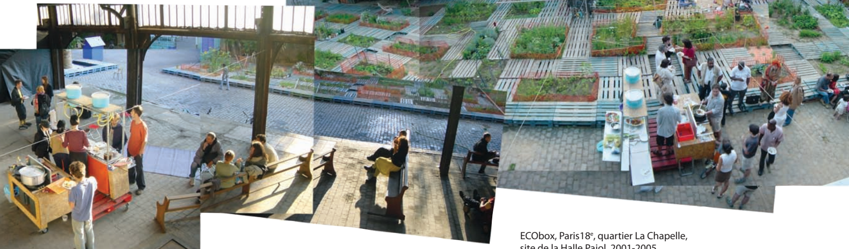
ECObox, Paris 18 e , quartier La Chapelle, site de la Halle Pajol, 2001-2005.