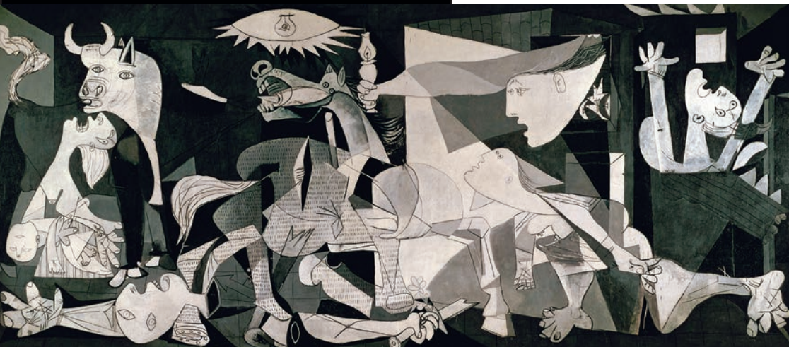
> Pablo Picasso, Guernica , 1937.

La nécessité d'améliorer ses conditions de vie, d'être reconnu et admiré en ces moments difficiles, conditionne ses points de vue, ses intérêts, sa manière de se mettre en relation