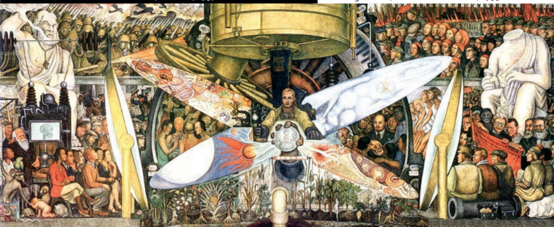
> Diego Rivera, Man at the Crossroads , 1933.