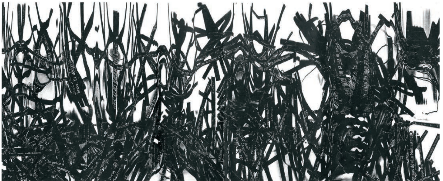
> paarcand, La forêt des mots renversés , panasonicgraphie, 1987.

La nécessité de concepts plus adaptés au travail d'Arcand se fait sentir. C'est que la machinimalité d'Arcand ne tend pas vers le bruit de sa pleine productivité ; au contraire, le bruit est sa seule productivité et s'accorde donc au régime, avec ses baisses et ses reprises. La machine d'Arcand produit un bruit qui est la transposition d'une écriture, de l'effort d'un corps. C'est une écriture en constant devenir d'autre chose sans que la transformation ne s'accomplisse parfaitement : l'état de confusion entre les phases me semble le territoire couvert par l'œuvre, sans au-delà, sans destination, seulement en mouvement.