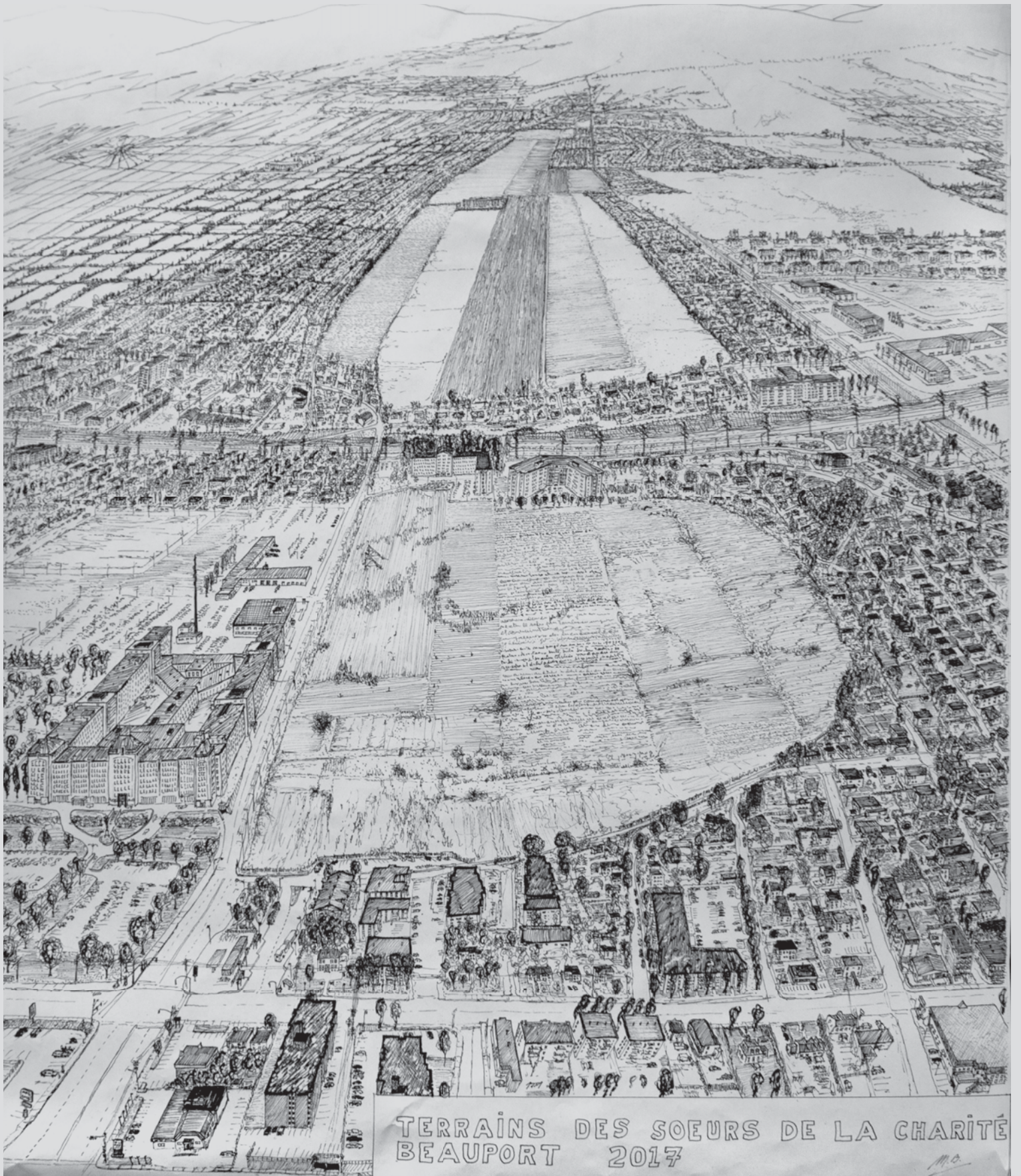
TERRAINS DES SOEURS DE LA CHARITE BEAUPORT 2017