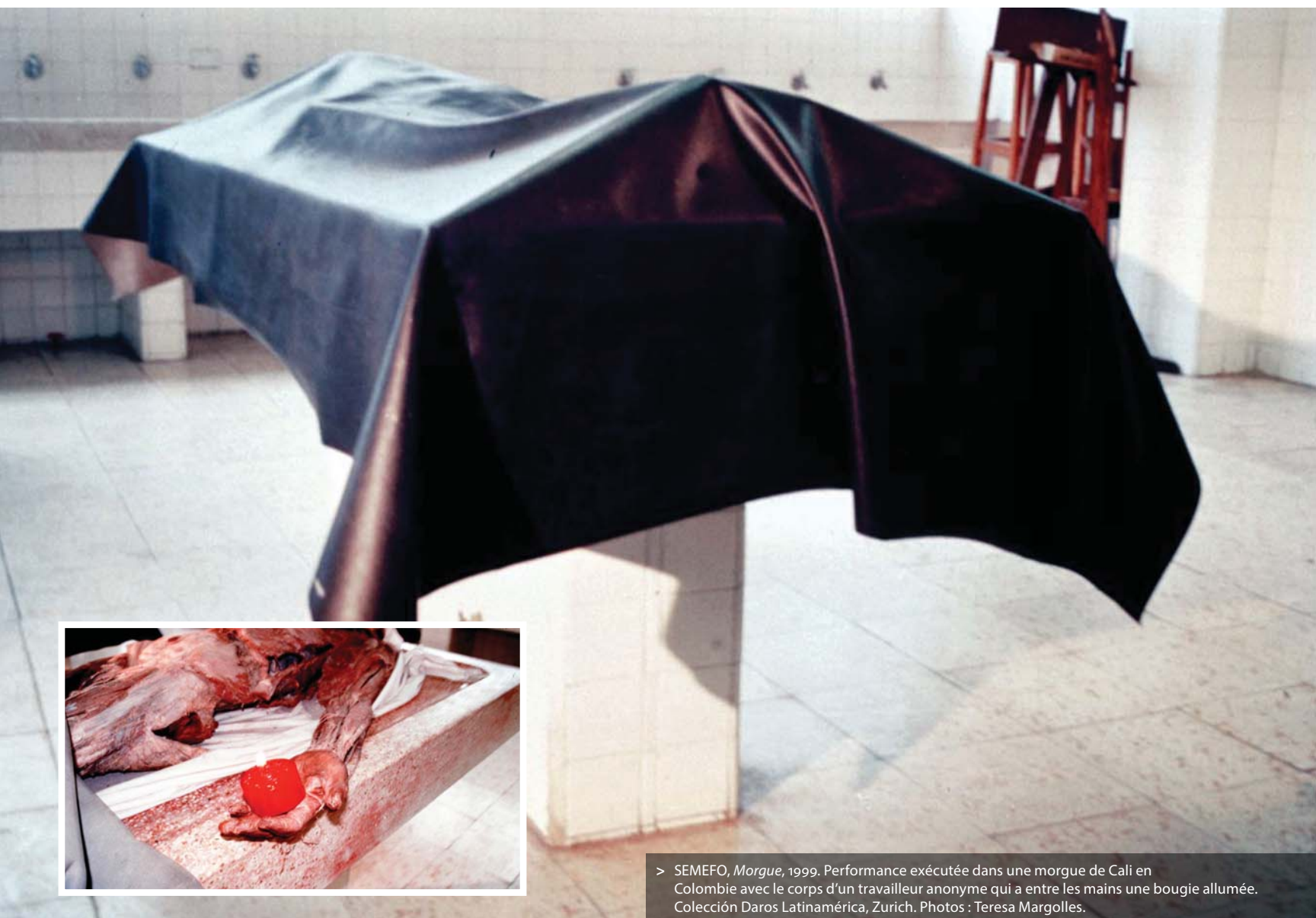
> SEMEFO, Morgue , 1999. Performance exécutée dans une morgue de Cali en Colombie avec le corps d'un travailleur anonyme qui a entre les mains une bougie allumée. Colección Daros Latinoamérica, Zurich. Photos : Teresa Margolles.