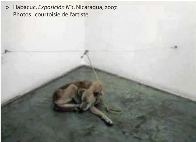
> Habacuc, Exposición N°1 , Nicaragua, 2007.

Ce qui a été mis de côté dans toute cette affaire a été le questionnement à propos du sens de l'œuvre. L'exposition était composée d'un enregistrement sonore de l'hymne sandiniste reproduit à l'envers, d'un encensoir où l'on a brûlé 175 cailloux