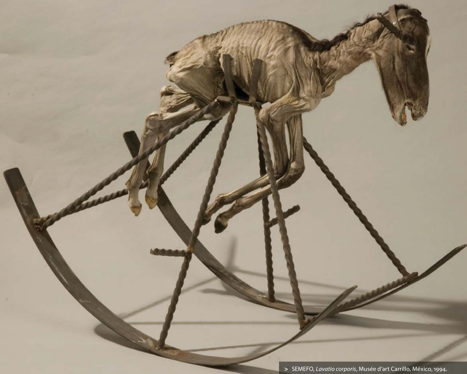
> SEMEFO, Lavatio corporis , Musée d'art Carrillo, México, 1994.