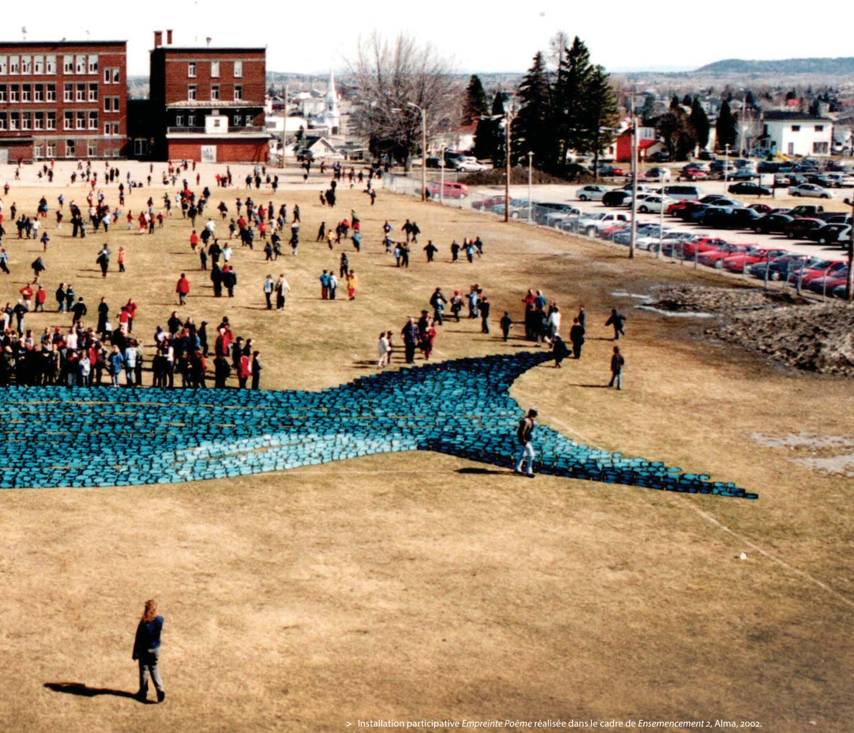
> Installation participative Empreinte Poème réalisée dans le cadre de Ensemencement 2 , Alma, 2002.

ville d'Alma, et d' On ne souille pas (1983) dans le cadre d'Art et écologie : un temps, six lieux, auquel Jocelyn Maltais et Alain Laroche participent sous le nom du collectif Interaction Qui. Sculpture sociologique (1980) et La salle Tremblé plafonnée (1983) remettent en question l'idée que l'art se définit par ses institutions. J'interviens lors des audiences publiques sur la gestion du lac Saint-Jean par la compagnie Alcan avec La noyade de Maria Chapdelaine (1985) et je construis l'assise théorique d'Interaction Qui lors de ma maîtrise en art, en développant le concept de « nœud événementiel » (1987). Interaction Qui écarte ainsi les formes traditionnelles et institutionnelles de l'art pour s'engager dans une forme à la fois citoyenne et territoriale de l'art. Il faut attendre la commande d'une célébration de l'emblème animalier du Saguenay-Lac-Saint-Jean (1989) par des représentants des deux sociétés d'histoire et une trentaine d'organismes des milieux économique et communautaire pour qu'Interaction Qui programme Événement ouananiche, « un méga événement d'art en évolution ( work in progress ) [...], une tautologie des stratégies de l'art social mise de l'avant par le collectif au Saguenay-Lac-Saint-Jean » 4 .