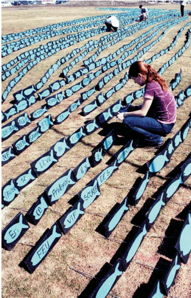
> Installation participative Empreinte Poème réalisée dans le cadre de Ensemencement 2 , Alma, écriture de poèmes sur les 5 000 tacons bleus, 2002.