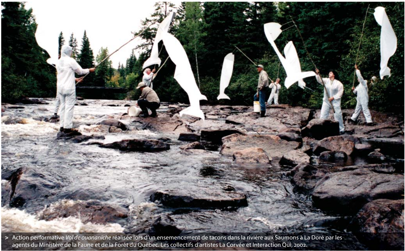
> Action performative Vol de ouananiche réalisée lors d'un ensemencement de tacons dans la rivière aux Saumons à La Doré par les agents du Ministère de la Faune et de la Forêt du Québec. Les collectifs d'artistes La Corvée et Interaction Qui, 2002.