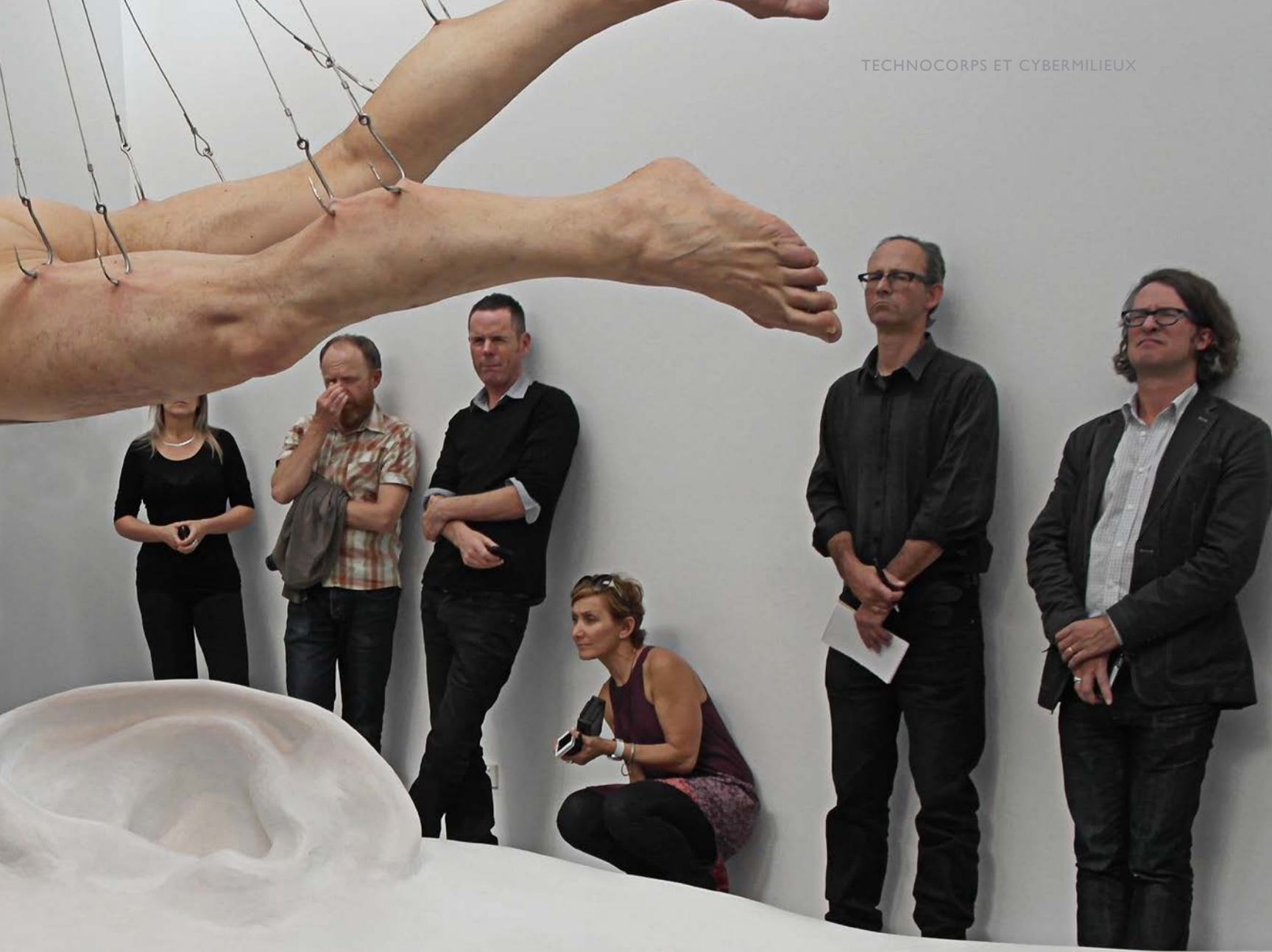
> Stelarc, Ear on Arm Suspension , Galeries Scott Livesey, Melbourne, 2012.

des portails pour d'autres gens, dans d'autres endroits. Imaginons-nous en train de voir avec les yeux de quelqu'un à Paris tandis que nous entendons avec les oreilles de quelqu'un d'autre à Los Angeles et que quelqu'un à Tokyo a accès à notre bras gauche, accomplissant une tâche à laquelle notre bras droit collabore. Les corps s'annihilent à la surface d'un écran électronique fait d'expériences sensorielles et haptiques, un écran électronique qui a une épaisseur à la fois optique et haptique. Des corps éloignés deviennent des effecteurs finaux pour d'autres corps, dans d'autres places, pour d'autres machines, dans d'autres endroits, générant des mises en boucle interactives et des chorégraphies récursives. La Fractal Flesh ( Chair fractale ) prolifère. La Phantom Flesh ( Chair fantôme ) devient puissante.