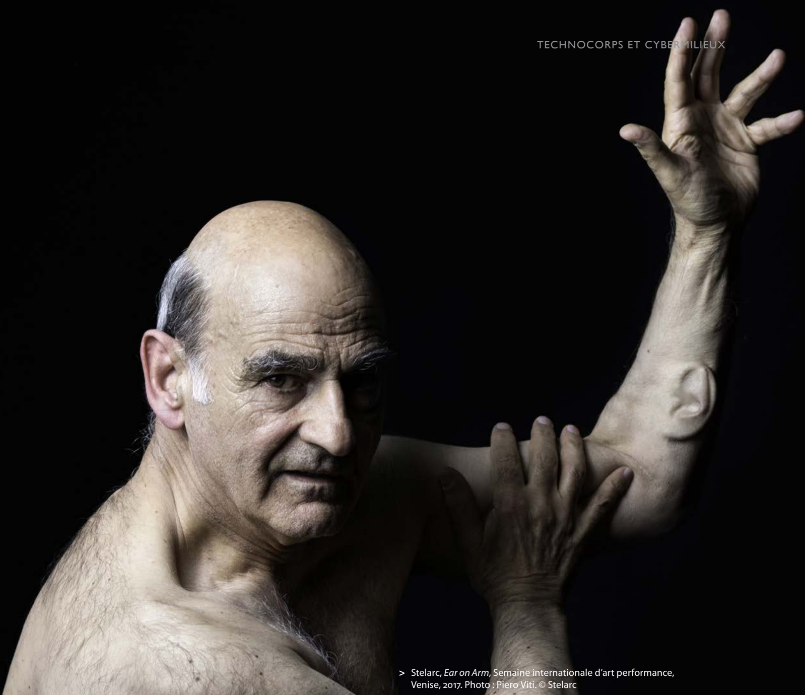
> Stelarc, Ear on Arm , Semaine internationale d'art performance, Venise, 2017.

pour mélanger le matériel génétique dans le but de créer de la diversité dans notre espèce et pour contrôler les naissances ne feront plus partie des contraintes de notre existence. Comme des parties du corps seront reproduites artificiellement, comme nous pourrions imprimer en 3D des organes et les concevoir à partir de cellules souches, il y aura un excès d'organes, d'organes sans corps, d'organes en attente de corps.