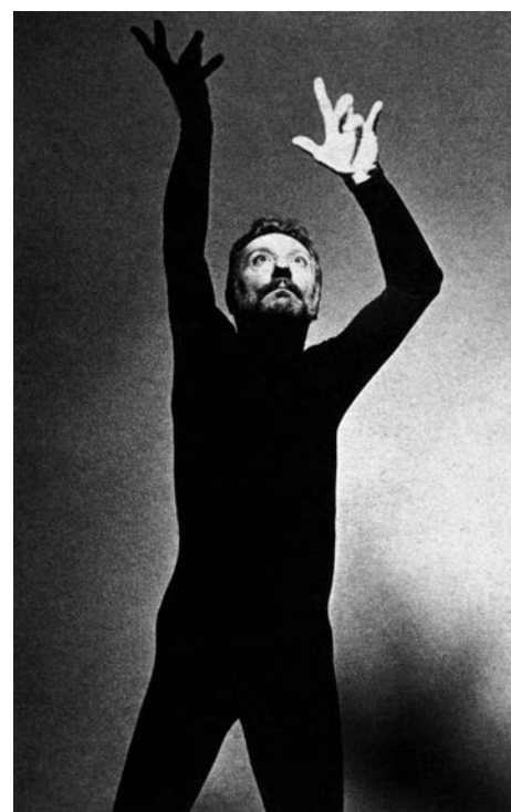
> Arrigo Lora Totino, Poesia Ginnica , Milan, 1978.

Pour Sarenco, la photographie a une valeur complètement différente. Elle a une valeur politique très forte, comme dans les œuvres de sa série Licence poétique . La plus connue est celle de la jeune fille qui jette une pierre, en lien avec certains de ses portraits, presque des « performances photographiques ». Je tiens à mentionner, pour terminer, celle intitulée « Le poète terroriste ». Quelle provocation extrême du bon poète ! ◀