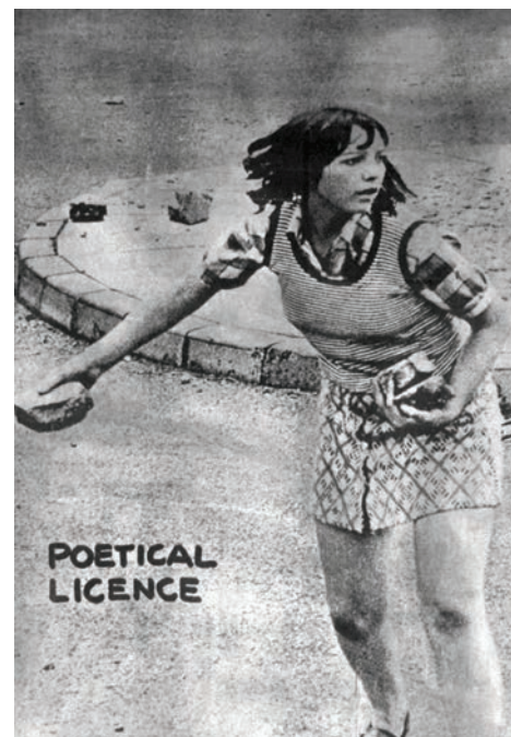
> Arrigo Lora Totino, Sublime essenza obsoleta , Turin, 1976.