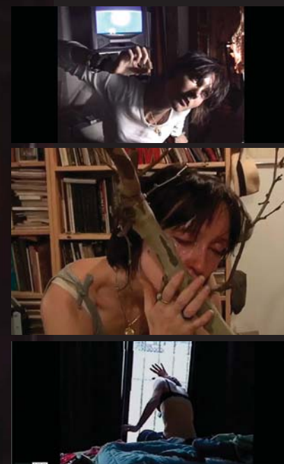
> Opera Epileptic Butoh