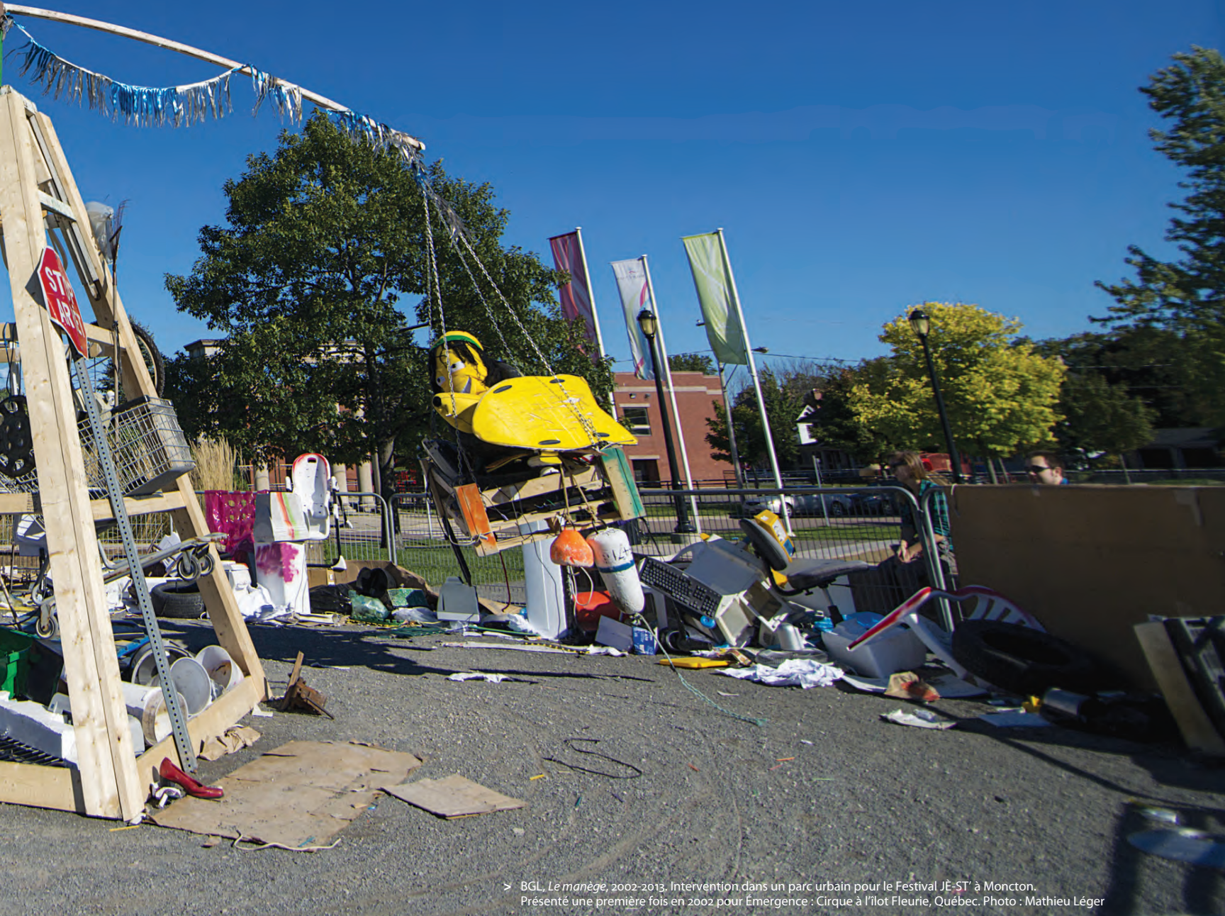
> BGL, Le manège, 2002-2013. Intervention dans un parc urbain pour le Festival JÉ-ST' à Moncton. Présenté une première fois en 2002 pour Émergence : Cirque à l'îlot Fleurie, Québec.