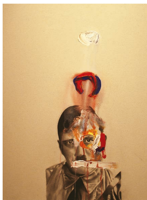
> Marc Séguin, Study for Success and Failure of Abstract Art , 2010. Huile et fusain sur toile. 60 x 50 cm.