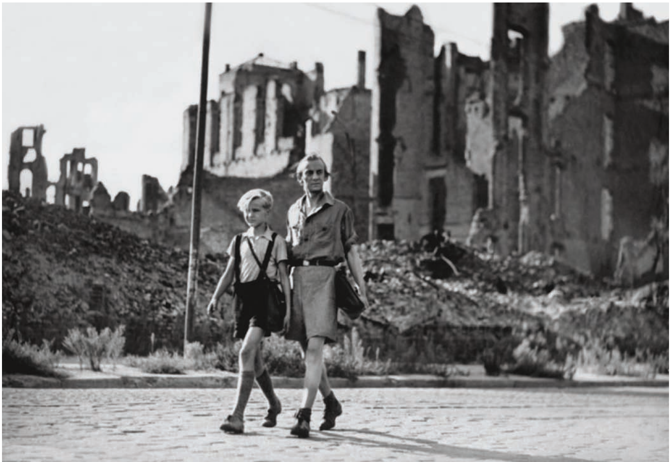
Allemagne année zéro (1947) de Rossellini

LE CINÉMA A FAIT DE LA VILLE LE SYMBOLE MÊME DE LA CIVILISATION. PUISQUE L'EXISTENCE DES MÉTROPOLES sollicite l'ensemble du génie humain, puisque chaque cité, par ses édifices et ses monuments, signe de son nom les images qui y sont tournées, les villes ont acquis une place considérable dans la représentation cinématographique. Ainsi, les images de la destruction d'une ville signifient davantage que les amas de béton et d'autres matériaux qui jonchent le sol : ces images cristallisent tantôt une souffrance ou une angoisse, tantôt un échec. De sorte qu'on peut facilement prétendre que lorsque, dans la mythologie cinématographique, l'Homme envisage sa propre fin, c'est souvent à travers la destruction des villes.