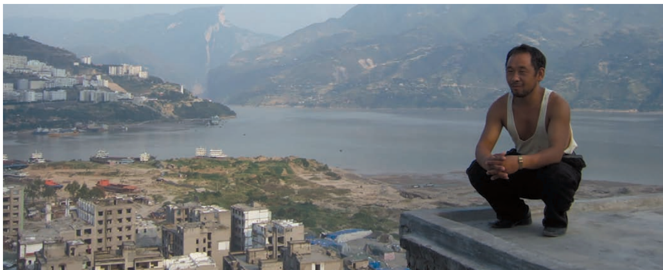
Still Life (2006) de Jia Zhang-ke

Escape from New York témoigne plutôt d'une ville victime du dérèglement. Les errements moraux 3 sont à l'origine de la destruction du tissu social, selon une trajectoire parente de ce qu'il advient dans le Berlin de Rossellini.