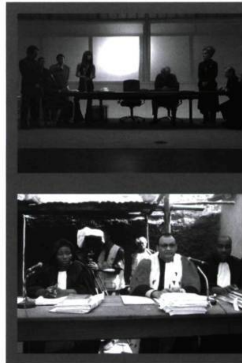
Southland Tales de Richard Kelly et Bamako d'Abderrahmane Sissako.