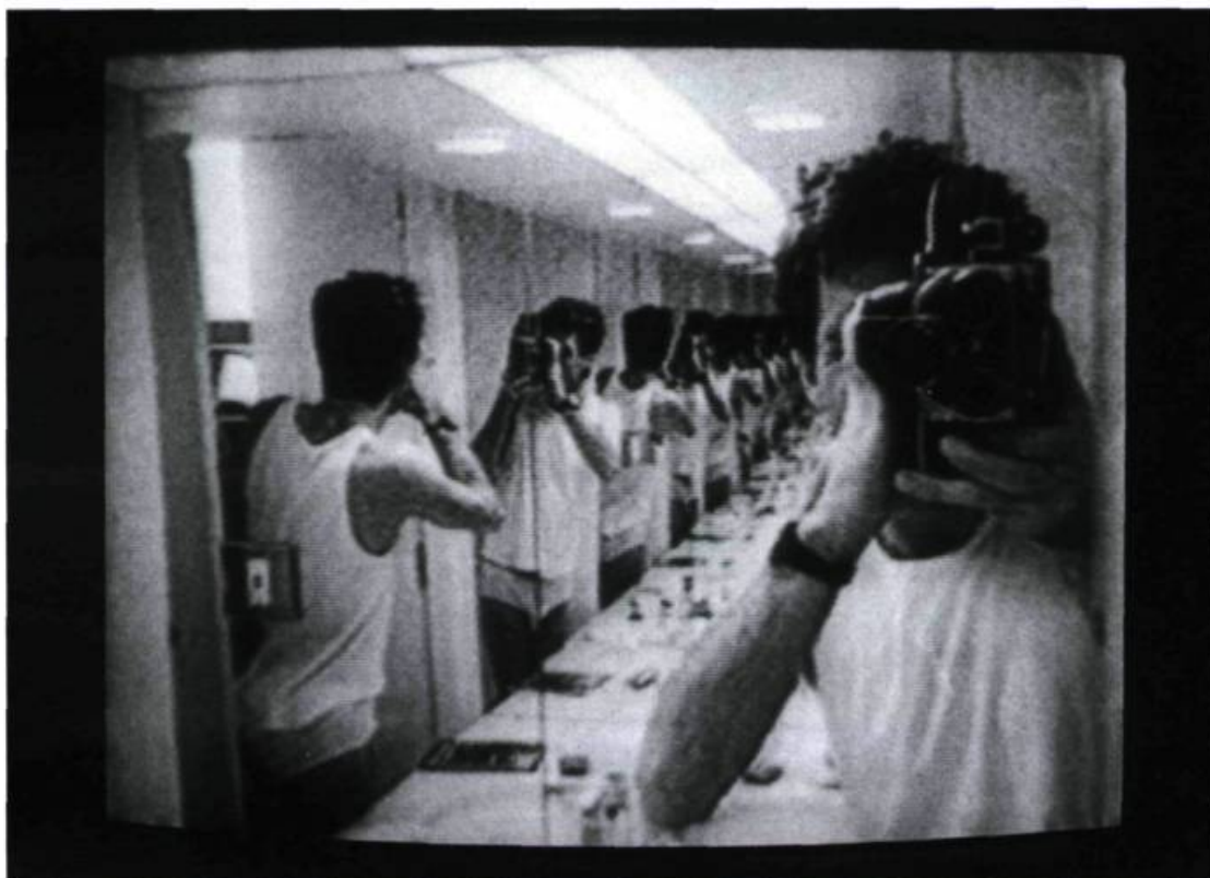
Yes Sir! Madame... (1995).

des quêtes. Et des fois, l'enquête se mêle à la quête. Comme dans Yes Sir! Madame... ou Windigo .