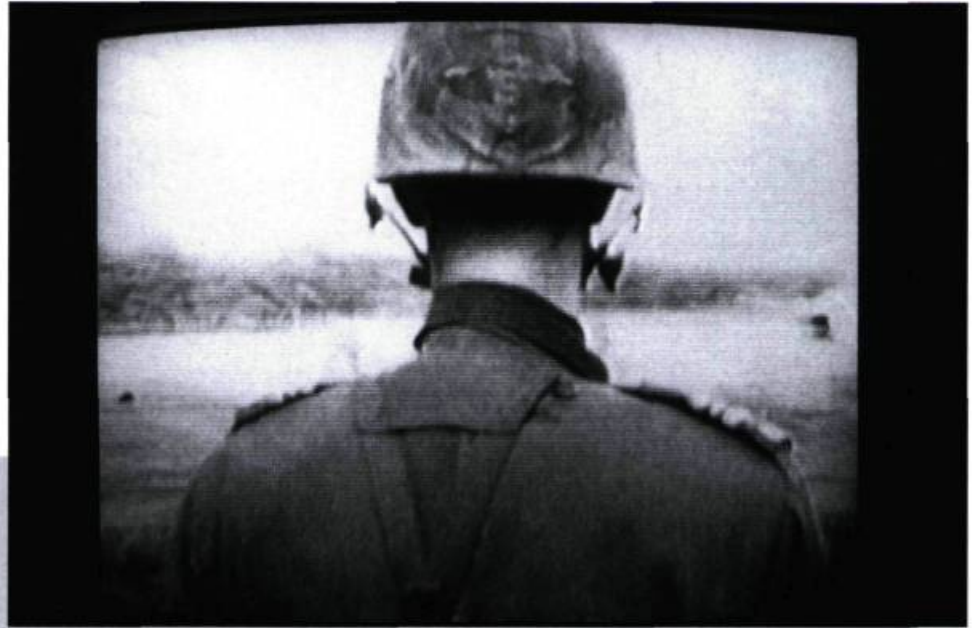
Gus est encore dans l'armée (1980).

La frontière entre les deux ne m'a jamais semblé très claire. J'emploie ces termes-là parce que ce sont les seuls qui existent, mais, au fond, je ne vois pas vraiment de différence entre les deux. Même dans un documentaire classique, les gens jouent leur propre fiction. Et même les fictions les plus triviales documentent un aspect de la réalité. Le but de ce que je fais, c'est d'ailleurs souvent de distiller le doute dans l'esprit du spectateur, doute sur la forme, doute sur le fond.