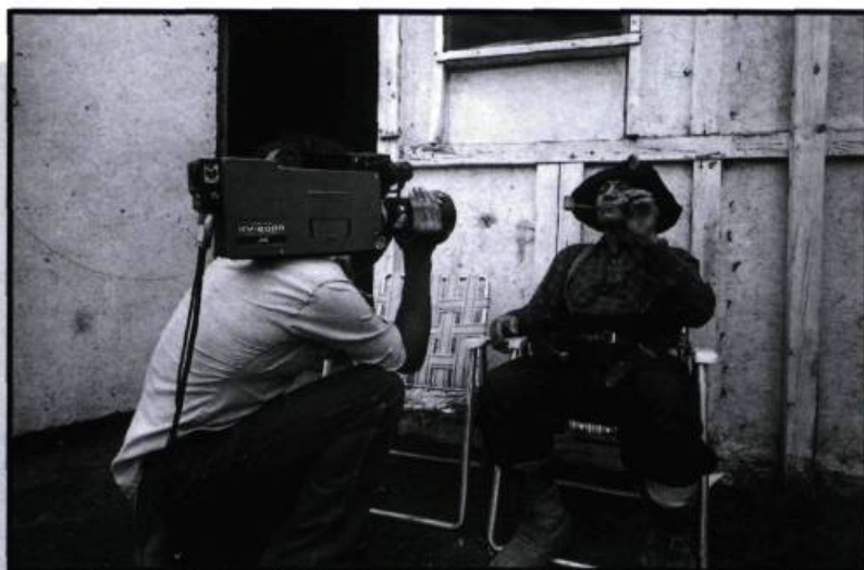
Tournage du Mystérieux Paul (1983).

Une histoire, c'est quelque chose de prenant. Et on n'est pas tous «prenables» de la même façon. Pour moi, l'histoire idéale, c'est celle que le spectateur complète. Or, le cinéma, c'est surtout pas ça: on te donne toujours tout. Une des choses que j'ai essayé d'explorer depuis que je fais des vues, c'est de laisser des trous, des zones d'ombre qui obligent le spectateur à deviner un certain nombre de choses. Parce que en fait, une histoire, c'est quelque chose d'extrêmement personnel; c'est rien tant que ça n'a pas rebondi dans l'âme de quelqu'un. À partir du moment où tu donnes toutes les clés, comme Spielberg le fait, eh bien tu ne rebondis nulle part. Si tu regardes E.T. , il n'y a aucune zone d'ombre à part d'où il vient ( rires )!