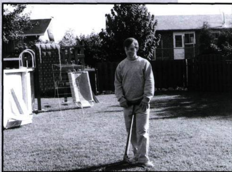
Tristesse modèle réduit (1989).