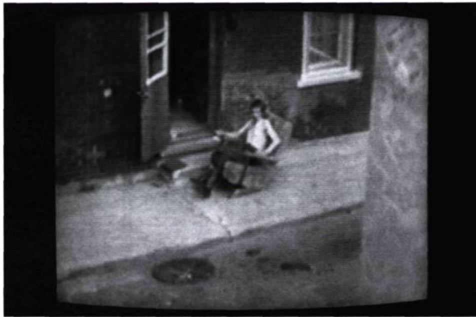
Le voleur vit en enfer (1984).

Ben, c'en est une grosse partie en tout cas. Il y a autant de vérité à descendre qu'à monter. Or, il se trouve que la majorité des films nous montrent des envols. Alors ça fait du bien à un moment donné de dire: «On peut pas juste voler dans la vie; à un moment donné, il faut piquer!» C'est juste ça mon affaire, dans le fond: essayer d'aller dans une place où les autres ne vont pas. D'abord, parce que ça me tente, mais aussi parce que c'est plus tranquille de toute façon ( rires ). En fait, j'aime déséquilibrer le spectateur; partir avec un personnage qui est hyper archétypé, et montrer à l'arrivée que lui et le spectateur se ressemblent comme deux gouttes d'eau.