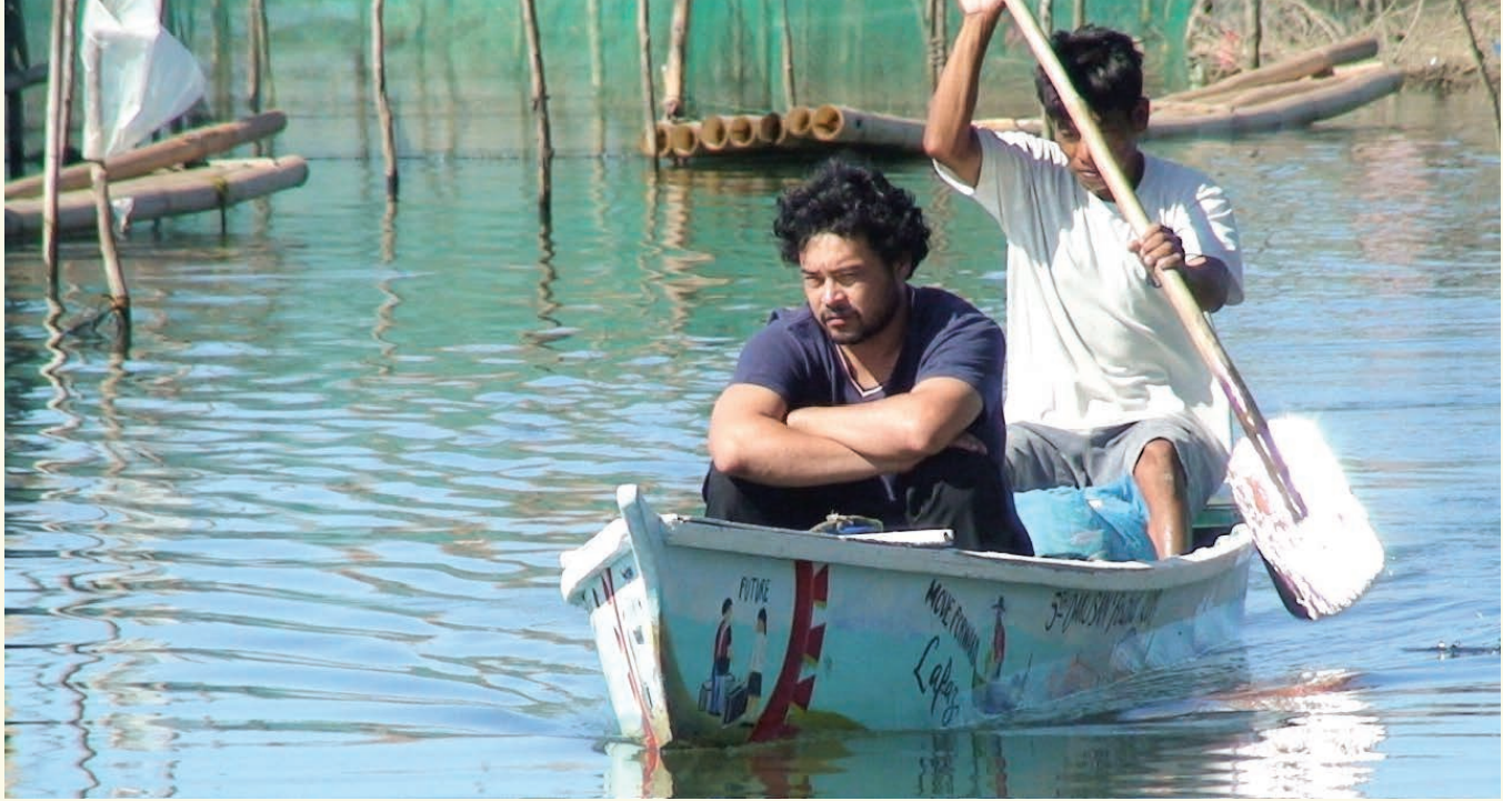
NORTE, LA FIN DE L'HISTOIRE de Lav Diaz

provoquer un épuisement quasiment physique. Un grand film ne saurait être qu'adulé ou détesté. Un grand film ne raconte pas une histoire, il les raconte toutes, il n'en raconte aucune, il crée une transe. C'est le cas de La grande bellezza (un titre osé pour dire le cinéma, sa beauté noire parfois maléfique et non pas celle, déchue, de la Rome de Romulus et Remus), de Jarmusch et de ses vampires, créateurs métaphoriques et dépositaires de toute la culture de ces 500 dernières années.