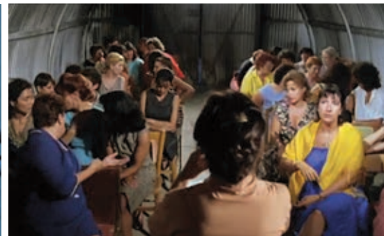
L'ARGENT FAIT LE BONBHEUR de Robert Guédiguian

Une œuvre luttopique n'est pas la mise en scène ou en images d'une idée. Elle permet de « penser en homme d'action et d'agir en homme de pensée » (Bergson) afin de ne pas se contenter du kantisme de la pureté de l'idéal jamais sali par l'action concrète. C'est une action poétique (du grec poiëin , faire), un langage en train de se faire dans l'immanence, c'est-à-dire dont l'activité n'est pas séparable de ce sur quoi elle agit.