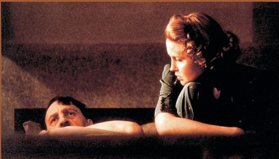
↑ Moloch (1999)