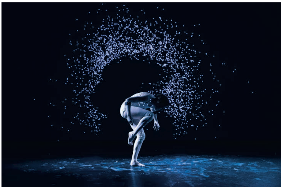
↑ Myself de Jean-Marc Matos (2019)