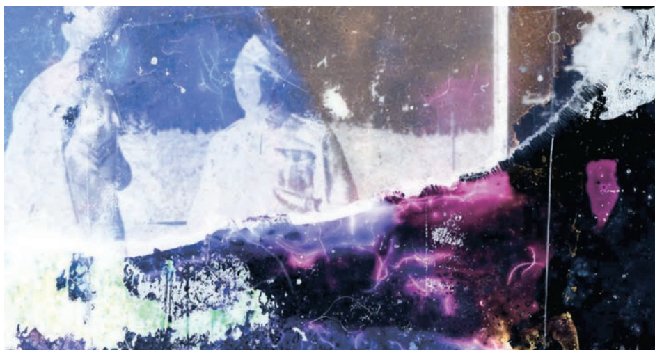
↑ Bulbe tragique de Guillaume Vallée (2016)