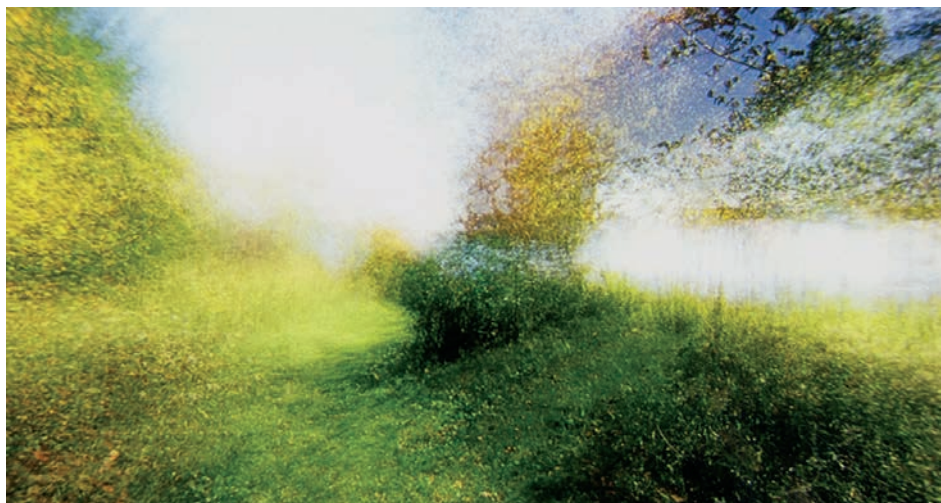
↑ Brouillard #14 de Alexandre Larose (2014)