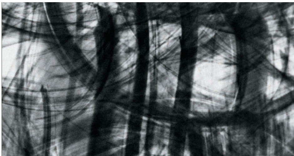
↑ Mamori de Karl Lemieux (2010)