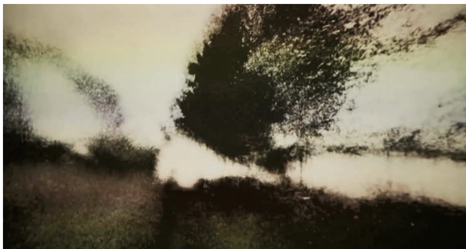
→ Brouillard #19 de Alexandre Larose (2014)