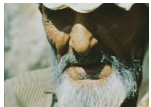
MÉDITERRANÉE (1963) de Jean-Daniel Pollet