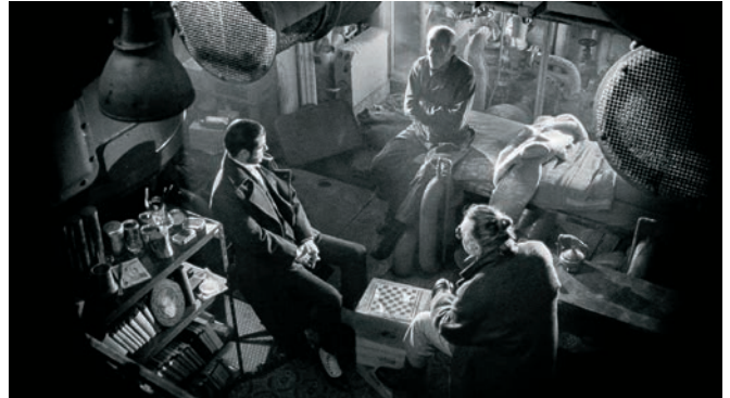
9 doigts (2017)

lorsqu'ils se rendaient en Amérique, puis au Cap-Vert lorsqu'ils revenaient. Dans ma jeunesse, j'ai été marqué par l'alchimie, par cette idée qu'il existe un centre du monde – et pour moi, les Açores représentent un peu ce centre du monde. L'Atlantique est un peu la Méditerranée moderne.