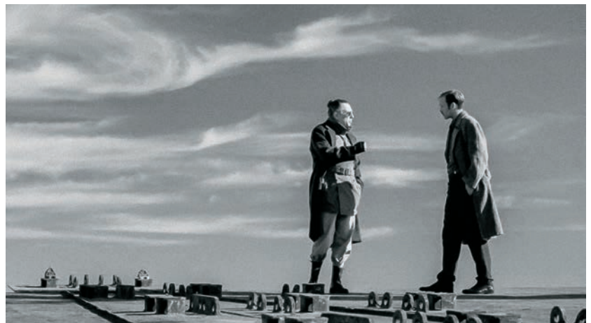
9 doigts (2017)

Le cinéma est un peu sorcier, au fond. Il relève de l'alchimie. Ce qui me fascine dans l'alchimie, c'est qu'il s'agit d'une forme de