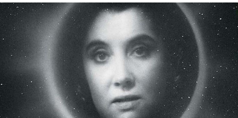
The Grandmother (1970), Eraserhead (1977) et The Elephant Man (1980)

stéréotypes masculins; on le décrit comme « maniéré, efféminé et enfantin », et plusieurs textes l'identifient, à tort, comme homosexuel 2 . La déstabilisation créée par l'utilisation de la voix d'Ivers pour un personnage féminin n'est pas la seule fois où Lynch utilise l'ambiguïté de genre dans une performance musicale pour obtenir un effet d'étrangeté: dans son texte « Le deuil et la musique dans Blue Velvet », David Copenhafer suggère que les performances musicales du film créent « une logique instable de genre et de sexualité » dans laquelle « il existe une confusion entre le visible et l'audible » 3 .