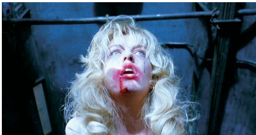
Peter Ivers (pochette du disque Terminal Love , 1974) et Twin Peaks: Fire Walk with Me (1992)

quelques mois de diffusion à la télévision publique de Los Angeles, l'émission est sélectionnée par le programme Night Flight de USA Network pour être diffusée à travers les États-Unis. Jove voit enfin de grandes choses se profiler à l'horizon.