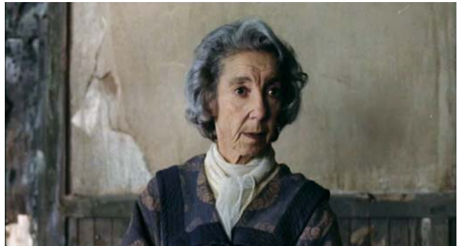
[1] Blue Velvet (Dorothy Vallens), [2-3] Twin Peaks (Sarah Palmer – Mrs Tremond)

qui s'interroge sur la nature des rêves et prend lui-même la forme d'une vision onirique. Dans le poème, le rêveur se trouve à l'intérieur d'un temple dédié à Vénus, la déesse de l'amour. Il y voit une tablette où est inscrite l'épopée de L'Énéide , et il se souvient comment Jupiter a ordonné à Énée de trahir son amante Didon, ce qui causa le suicide de cette dernière.