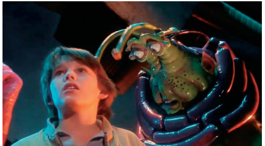
Explorers de Joe Dante (1985)

De 1969 à 1972, « on a marché sur la Lune ». À la fin des années 1970 et surtout dans les années 1980, l'aventure spatiale bat son plein : satellites, sondes ou stations spatiales sont lancés en grand nombre. Les sondes Voyager 1 et Voyager 2 explorent pour la première fois le système solaire, obligeant à reconsidérer tout ce que l'on croyait savoir jusque-là et à réécrire les manuels d'astronomie. Le cinéma témoigne de cet enthousiasme collectif pour les découvertes astronomiques : les sujets dont s'empare la science-fiction témoignent de cet engouement, tout en exploitant ces thématiques de façon ludique et fantastique. Outre les séries de films lucratives comme les Alien , Star Wars et autres Star Trek (initiées au cinéma à la fin des années 1970, développées dans les années 1980), on compte nombre de films « mineurs » mais habités par cette frénésie de l'espace : à titre d'exemples incongrus, le vétéran Stanley Donen s'attelle à la science-fiction avec Saturn 3 (1980), et le célèbre 2001 de Kubrick se voit attribuer une suite, 2010 (Peter Hyams, 1984). D'autres films s'adressent à un public très jeune, comme The Black Hole (« le trou noir », de la compagnie Disney en 1979) ou Explorers (Joe