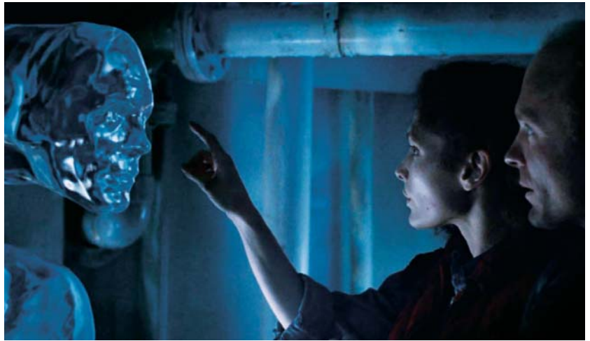
Arrival de Denis Villeneuve (2016) et The Abyss de James Cameron (1989)