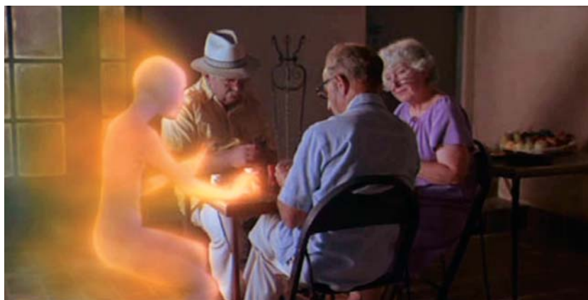
The Tree of Life de Terrence Malick (2011) et Cocoon de Ron Howard (1985)

Dante, 1985). Ce dernier raconte l'histoire de trois enfants qui s'envolent dans l'espace à l'aide d'une navette bricolée : c'est dit, l'espace sera le terrain de jeu des générations futures, et l'avenir appartient aux jeunes savants amateurs.