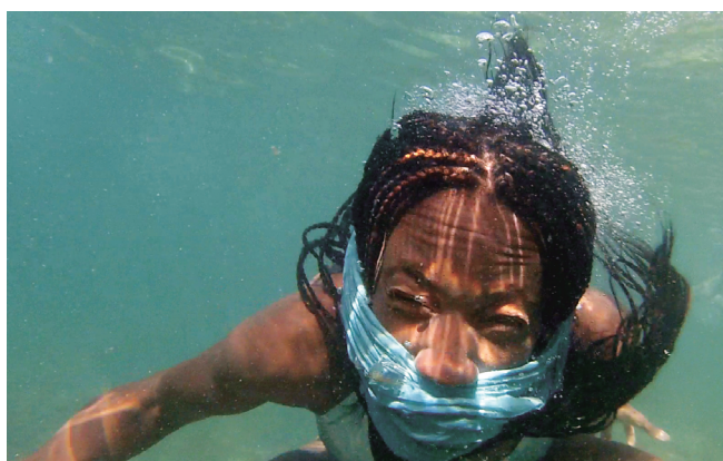
Sous la surface (2016) de Pauliina Salminen et Mouna Jemal Siala

Le défi relevé par Pauliina Salminen & Mouna Jemal Siala avec l'installation vidéo Sous la surface est à proprement parler inouï. Plongés dans un élément hostile (l'eau) à toute prise de parole, des femmes et des hommes enfouis sous la surface qui fait écran (la mer) donnent à qui veut bien l'entendre le point de vue de l'invisibilité : faire remonter des bas-fonds le cri des exclus du monde spectaculaire, ces naufragés de la mémoire que nous ne connaissons qu'en termes macabrement comptables ou sous l'appellation disparus . Nous pouvons véritablement parler d'une crise de la représentation. Le fameux « circulez, il n'y a rien à voir » de la police prend ici une allure indécente quand il s'agit justement d'humains qui ont sombré dans le contre-jour des projecteurs médiatiques.