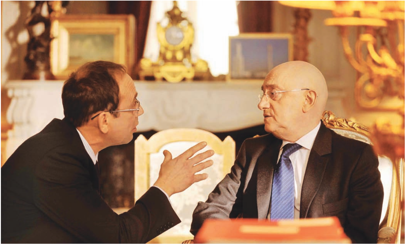
L'exercice de l'État de Pierre Schœller

A u cœur du troisième long métrage de Pierre Schœller, L'exercice de l'État , il y a cette idée selon laquelle la politique est une machine infernale, un puissant engrenage qui broie les hommes et leurs idéaux, comme cet alligator à la gueule ouverte qui avale une jeune femme nue (le pouvoir est érotiquement chargé, ne l'oublions pas) dans le rêve de Bertrand Saint-Jean, le ministre des transports incarné par Olivier Gourmet. L'idée aussi que le pouvoir s'exerce à travers sa mise en scène : un décor savamment déployé, des tapis, des meubles anciens, une disposition symétrique évoquant l'équilibre, un luxe immédiatement perceptible sans être ostentatoire... «Et nous serons des tigres affamés dans la nuit noire», dit le ministre, sur un ton presque shakespearien, comme pour se convaincre de remonter sur la scène publique, de replonger dans l'œil du cyclone, d'affronter encore une fois la terrible mécanique de l'État.