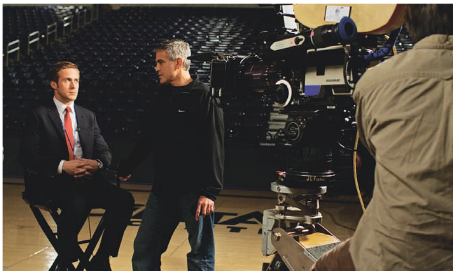
The Ides of March de George Clooney

fonctionnaire d'un superbe plan fixe, le montrant qui s'éloigne en franchissant, une à une, d'un pas d'homme affairé, les portes derrière lesquelles se trouve le bureau présidentiel. À l'avant-plan, le ministre, brièvement de profil puis de dos, regarde partir son allié sacrifié, avant de s'éloigner à son tour, d'un pas moins assuré cependant.