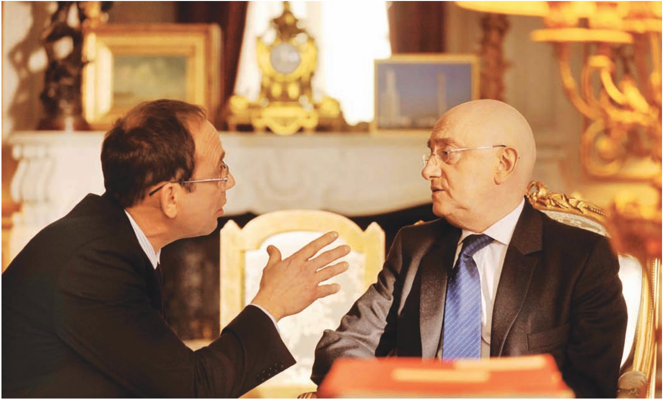
L'exercice de l'État de Pierre Schoeller

A u cœur du troisième long métrage de Pierre Schoeller, L'exercice de l'État , il y a cette idée selon laquelle la politique est une machine infernale, un puissant engrenage qui broie les hommes et leurs idéaux, comme cet alligator à la gueule ouverte qui avale une jeune femme nue (le pouvoir est érotiquement chargé, ne l'oublions pas) dans le rêve de Bertrand Saint-Jean, le ministre des transports incarné par Olivier Gourmet. L'idée aussi que le pouvoir s'exerce à travers sa mise en scène : un décor savamment déployé, des tapis, des meubles anciens, une disposition symétrique évoquant l'équilibre, un luxe immédiatement perceptible sans être ostentatoire... «Et nous serons des tigres affamés dans la nuit noire», dit le ministre, sur un ton presque shakespearien, comme pour se convaincre de remonter sur la scène publique, de replonger dans l'œil du cyclone, d'affronter encore une fois la terrible mécanique de l'État.